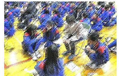
【地域の方と意見交換する様子】