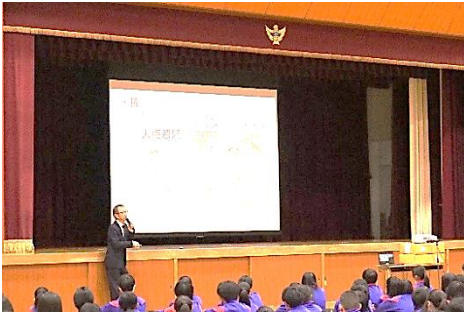
【校長先生の人権講話の様子】

12月8日(月)に、校長先生から「いじめと人権」「インターネットと人権」「差別と人権」「平和と人権」の4つのテーマでお話をさせていただきました。“人権”という言葉はよく耳にしますが、今回の講話で、少しでも“自分事”として考え、行動してほしいと思います。