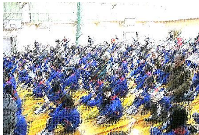
【クロスロードゲームに取り組むの様子】