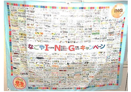
【職員室前のなごやINGフラッグ】

その後、各学級で振り返りをし、「なごやINGポスター」の作成をしました。みなさんが書いた感想の中から、いくつか紹介します。