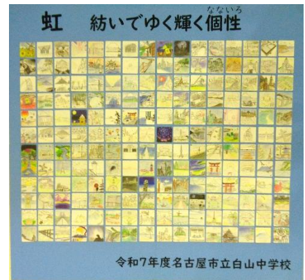
【行ってみたい場所～虹が繋げる私とあの場所～】

共同制作では、生徒と職員一人ひとりが「行ってみたい場所～虹が繋げる私とあの場所～」に取り組みました。それぞれの自分の行ってみたい場所を遠近法を使いながら描き、ペンと色鉛筆で仕上げました。その一枚一枚がまとまり、「新しい白山中学校の模様」が出来上がりました。披露されると盛大な拍手が沸き起こりました。