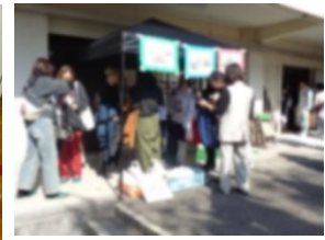
【展示した芋と持ち帰りの様子】