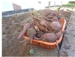
【収穫した後の様子】