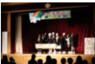
【1年学年タイムの様子】

生徒の皆さんは自分の学年はもちろん、他学年の発表や映像を見ては歓声を上げるなど、とても熱心に鑑賞していました。また、各学年の合唱曲の後には、拍手で温かく称え合っていました。