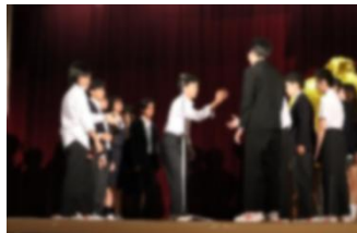
【2年学年タイムの様子】