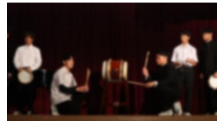
【まねっこリズムの様子】

最後に「全校音楽」。初めに『まねっこリズム』と題し、実行委員のリズムに合わせてみんなで手を叩きながら心をつなぐことができました。次に夢に向かって走る力、仲間とともに進む勇気が詰まった歌「全力少年」を全員で歌いました。最後に「白山中学校校歌」を歌いフィナーレを迎えました。全員が『笑顔』で盛り上がる姿に感動しました。それぞれの学年、それぞれの個性が輝き、まさに「虹」のような美しい時間を紡ぐことができました。