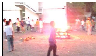
【キャンプファイヤー】