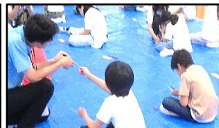
【バターナイフ作り】